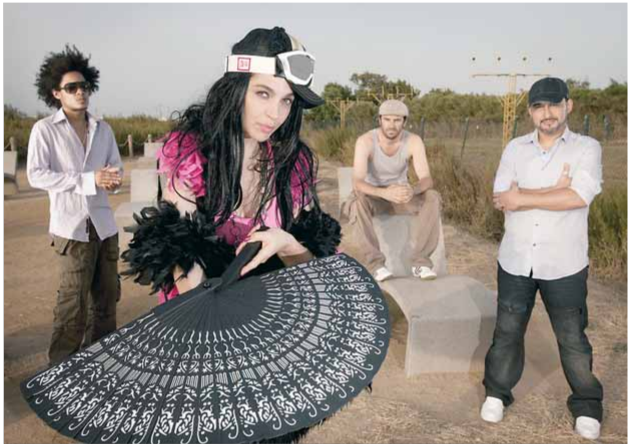
Els integrants de l'última formació d'Ojos de Brujo

Tot plegat, un cúmul de despropòsits d'un grup que ja fa temps que va de cap a caiguda per motius diversos. D'una banda, la