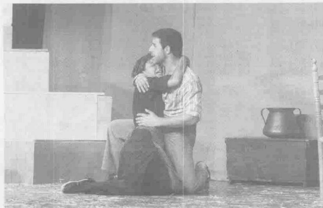
Una anterior representación de "Terra Baixa", en el montaje del grupo Qollunaka. PEDRO DIAS

Guimerà y ha trabajado en muchos montajes de Calixto Bieito y también con Joan Ollé, Rosa Novell, Esteve Pons y Magda Puyo, entre otros.