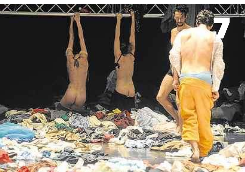
CHRIS VAN DER BURGH