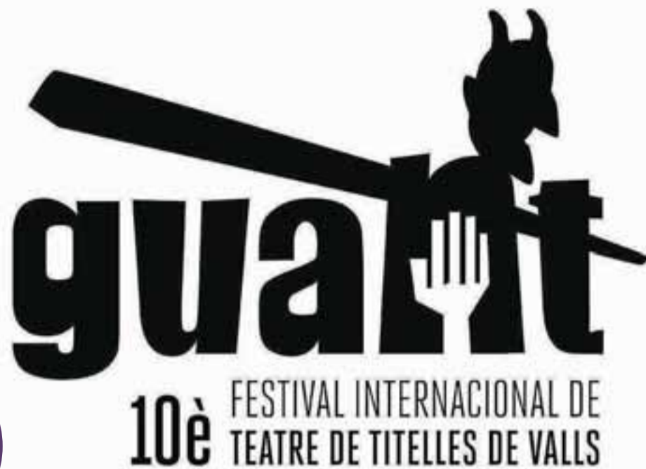
Cartell del festival 'Guant', que celebra el desè aniversari.