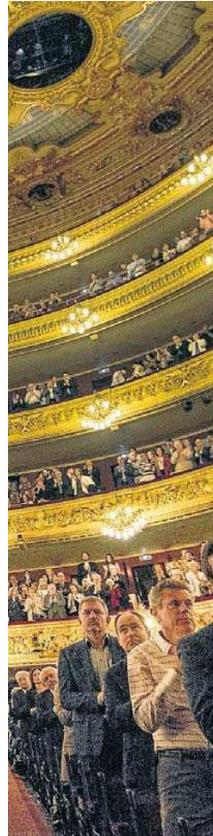
La platea del Gran Teatre del Liceu dempeus en l'acte d'homenatge a Montserrat Caballé el 8 d'octubre passat. MANOLO GARCÍA

mença, hi ha cert alliberament i el públic es deixa anar", descriu. En el seu cas, el baròmetre de l'èxit ja no són només els aplaudiments sinó també el fet de si aconseguen que el públic es posi dret o no. I això sí que va car.