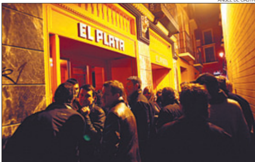
► El públic forma llargues cues per veure l'espectacle d'El Plata.